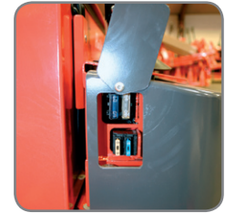
Let adgang til de enkelte dele gør det nemt at servicere vognen.