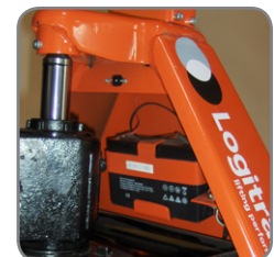
BFC6 har indbygget lader og nemt tilgængeligt ladestik.

Spørg efter flere informationer eller besøg www.logitrans.com