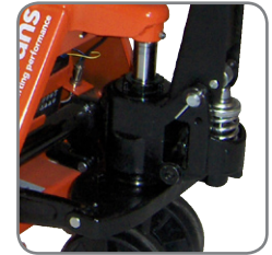
Holdbart og olietæt hydraulisk system.