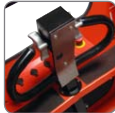
Elektronisk, trinløs hastighedsregulering. Central placering af alle betjeningsfunktioner.