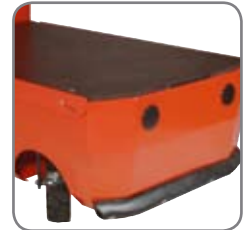
Bevægelige dele er afskærmet og dermed beskyttet mod stød o.lign.