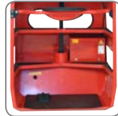
Lav indstigningshøjde for føreren. Pedalen virker som dødmanspedal.