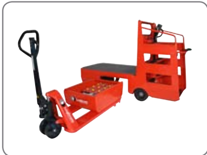
Batterierne er placeret i en skuffe – nem adgang til udskiftning og vedligeholdelse. Perfekt til flerholdsdrift.

Stærk konstruktion sikrer lang levetid og lave vedligeholdelsesomkostninger.