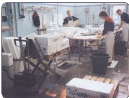
RF-SEMI - til fødevarerindustrien i de områder, hvor hygiejnekravene er mindre, men korrosionsbeskyttelse vigtig.