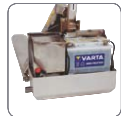
Vandtæt indkapsling af løftemotoren (EHL RF-PLUS).

Spørg efter materialespecifikationer eller besøg www.logitrans.com Vi tilbyder også kundetilpassede løsninger.