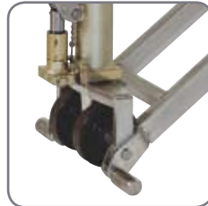
Optimal sikkerhed opnås med støttefodder ved styrehjul og central placering af alle betjeningsfunktioner på håndtaget.