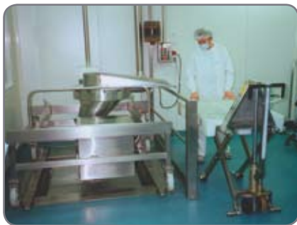
RF-PLUS - til fødevarerindustrien og den farmaceutiske industri, hvor der stilles store krav til hygiejne og rengøring.