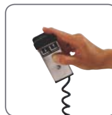
Fjernbetjening, også trådløs, fås som ekstraudstyr (EHL).