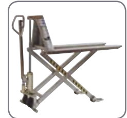
Den manuelle højtløfter fås også i en eksplosions sikret udgave.