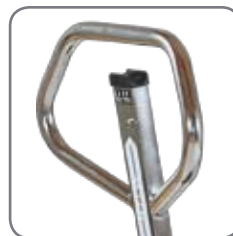
Ergonomisk håndtag giver brugeren et afslappet greb.